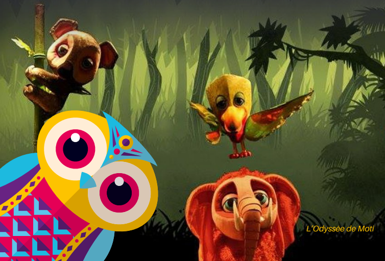
L'Odyssée de Moti